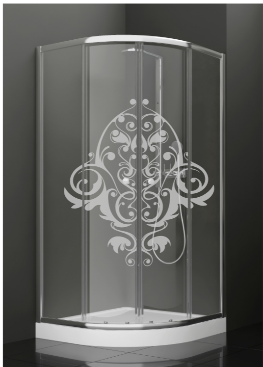
BAN - 1003