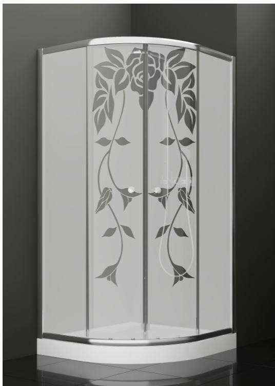
BAN - 2016