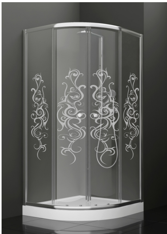
BAN - 1007