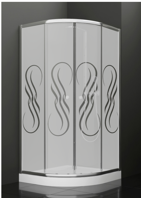
BAN - 2013