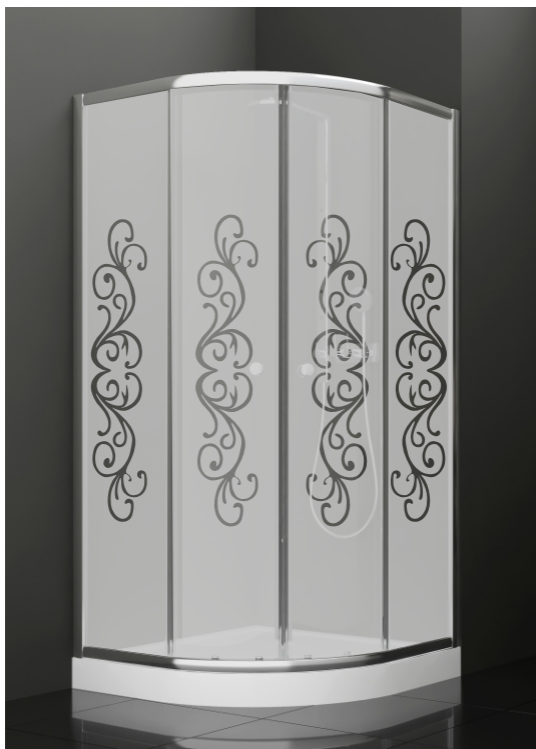
BAN - 2002