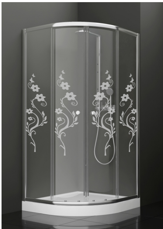
BAN - 1008