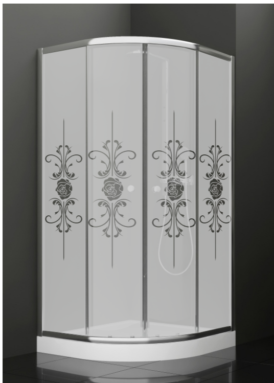
BAN - 2004