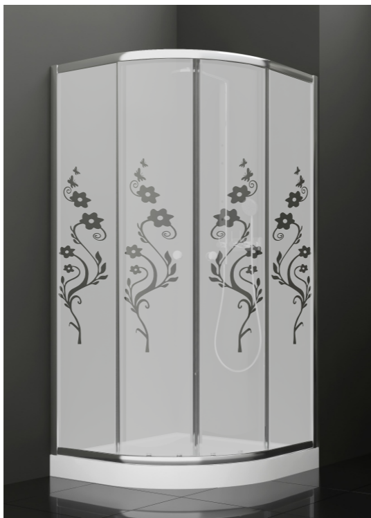
BAN - 2008