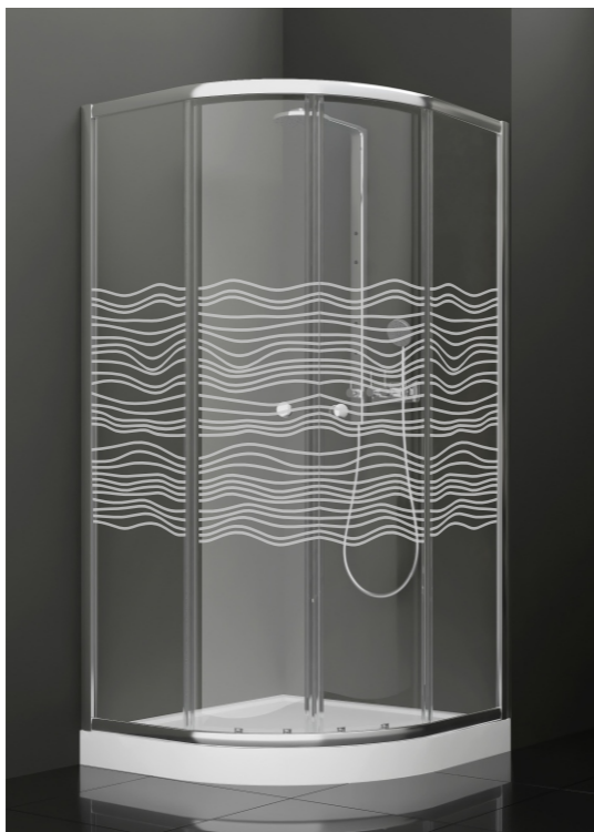
BAN - 1009