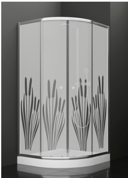
BAN - 2012