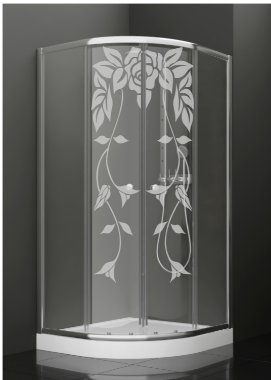
BAN - 1016