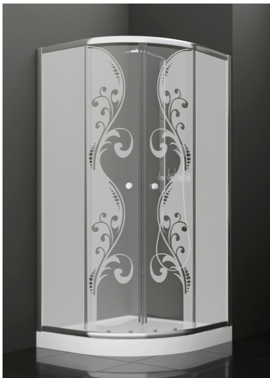
BAN - 2017