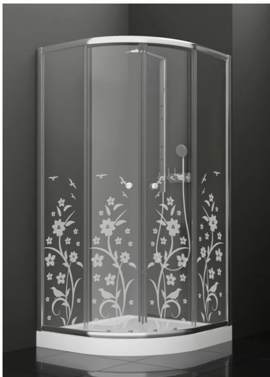
BAN - 1018