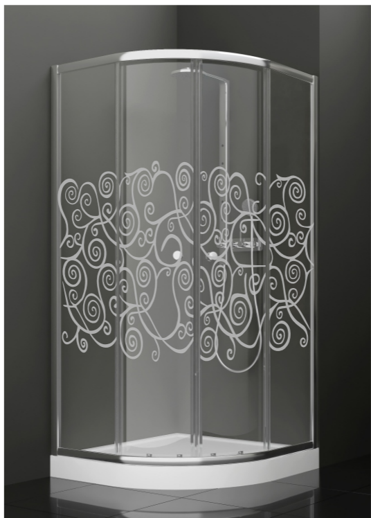
BAN - 1001