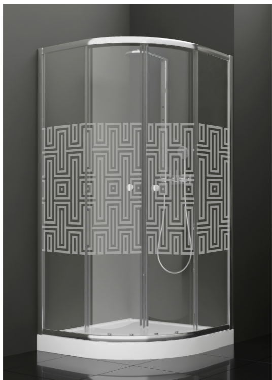
BAN - 1010