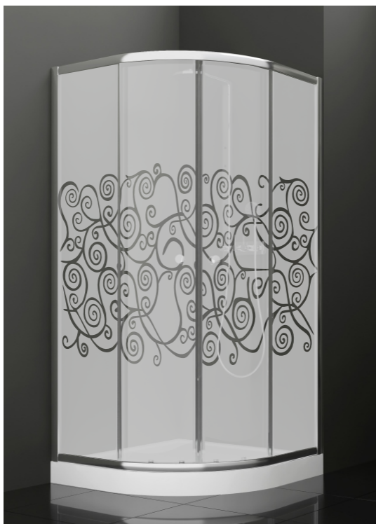
BAN - 2001