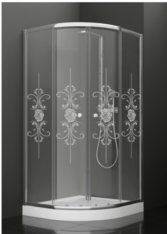
BAN - 1004