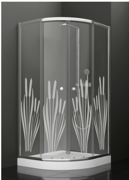
BAN - 1012