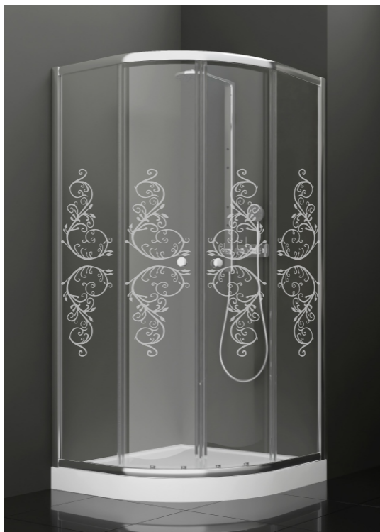
BAN - 1006