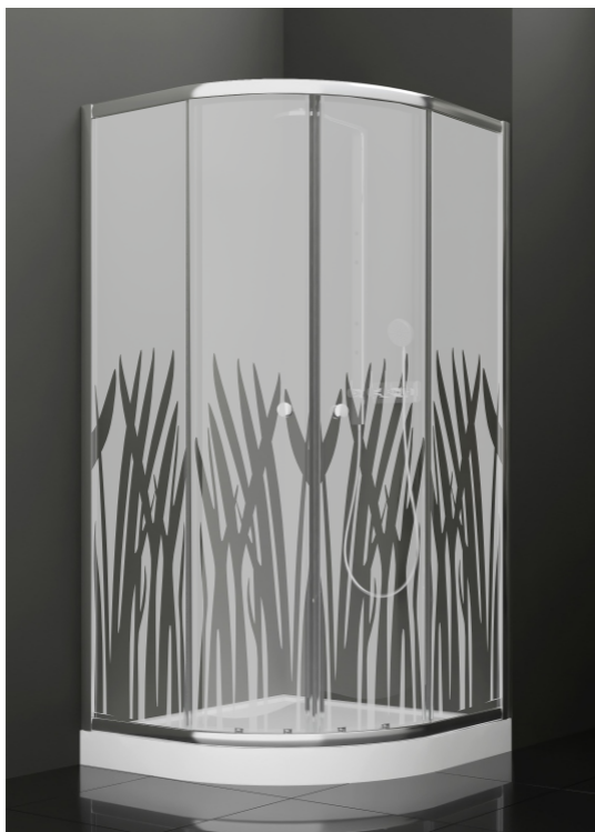
BAN - 2011