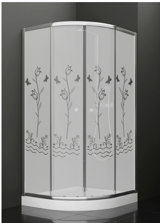
BAN - 2015