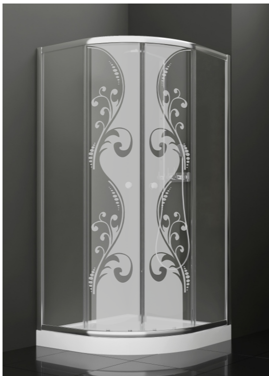
BAN - 1017