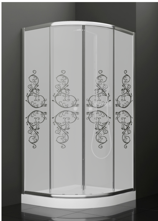
BAN - 2006