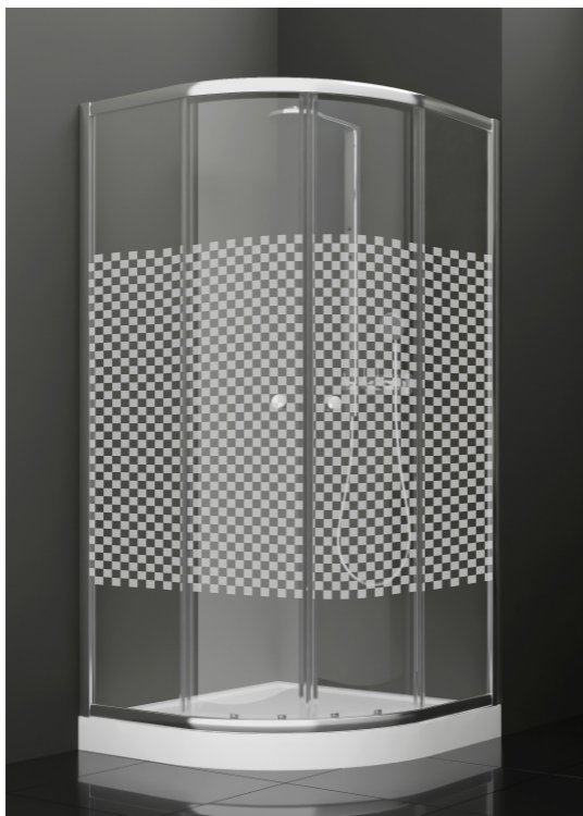
BAN - 1021