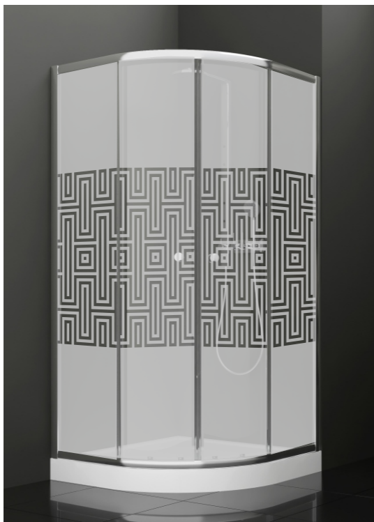
BAN - 2010