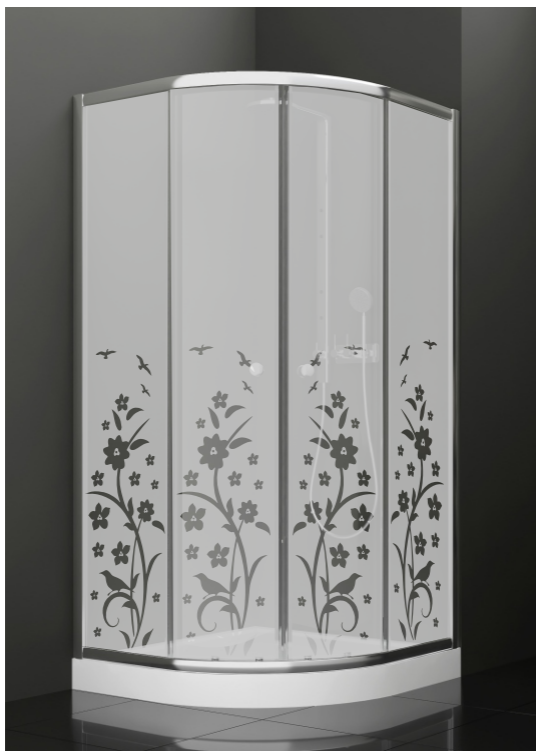
BAN - 2018