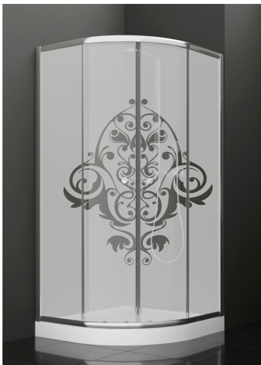
BAN - 2003