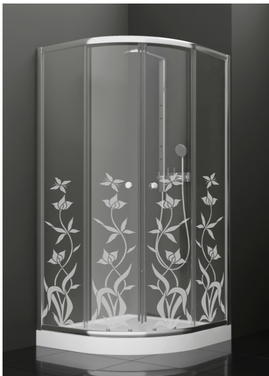
BAN - 1014