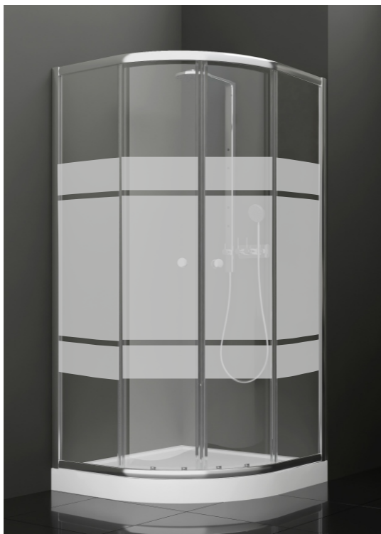
BAN - 1022