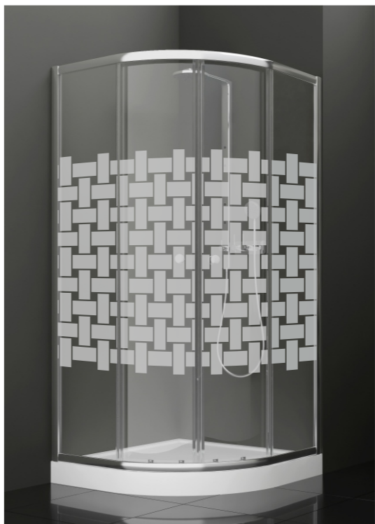
BAN - 1005