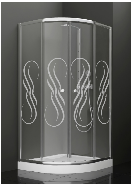
BAN - 1013