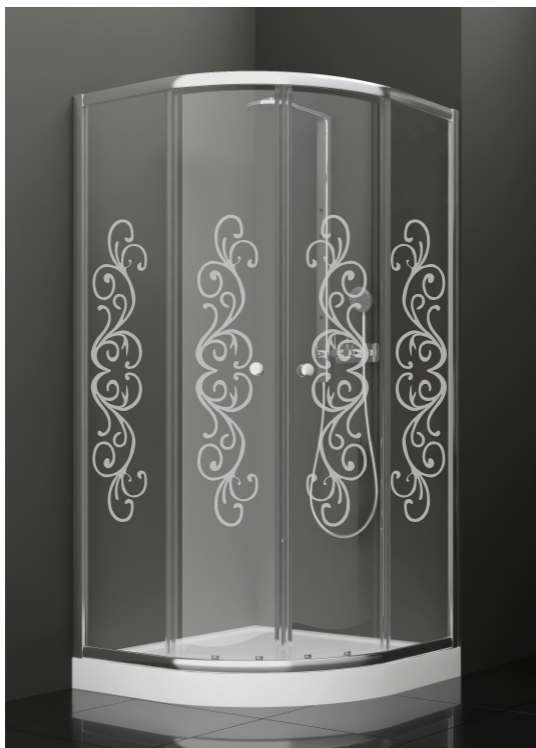
BAN - 1002