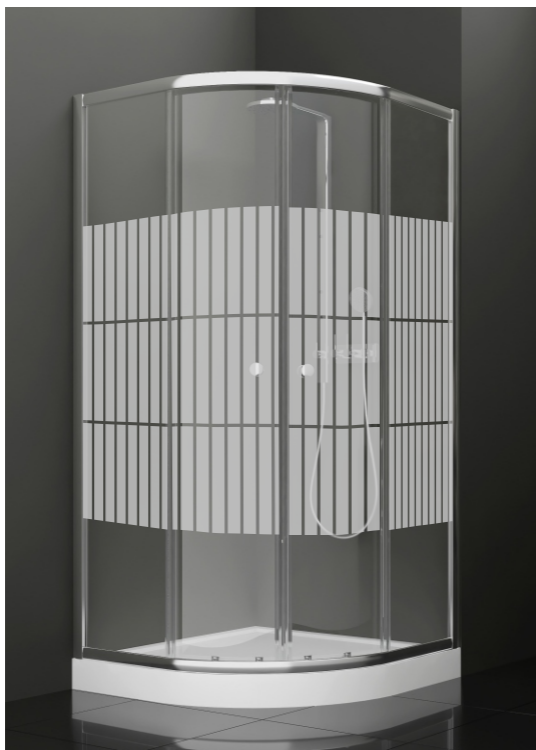
BAN - 1019