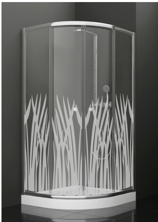
BAN - 1011