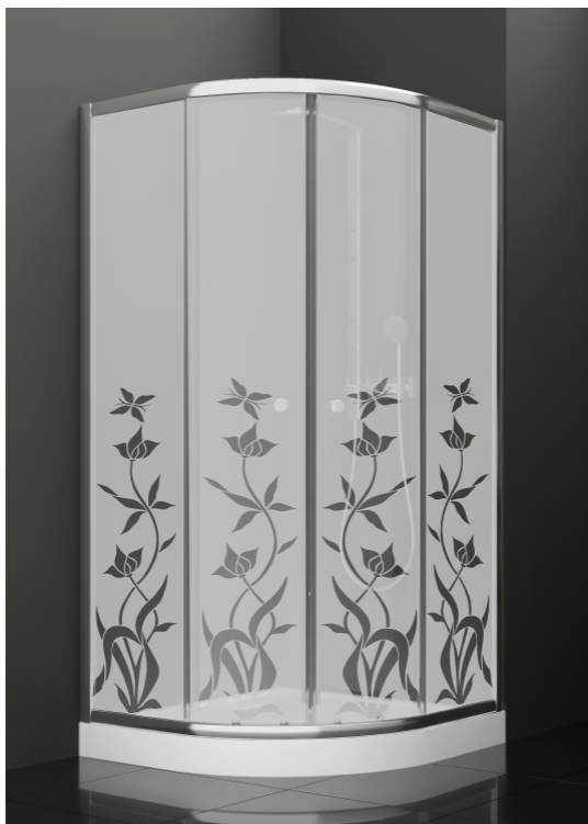
BAN - 2014