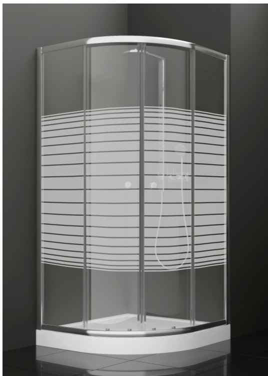
BAN - 1020