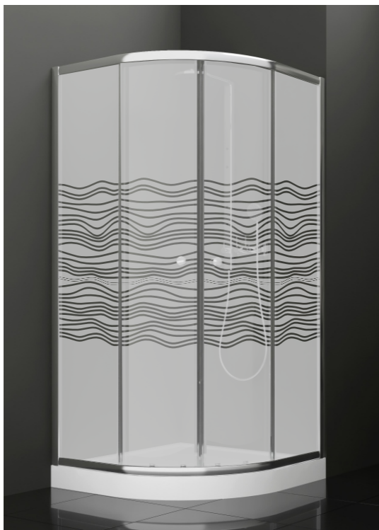
BAN - 2009