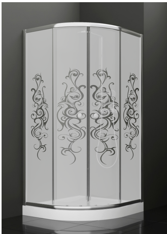
BAN - 2007