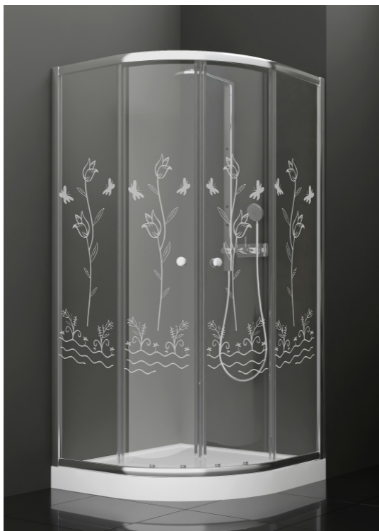
BAN - 1015